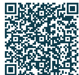
Informationen über SONOAIR

Setzen Sie auf Sicherheit und Effizienz – mit Luftultraschalllösungen von SONOTEC für Ihre Keramikproduktion.